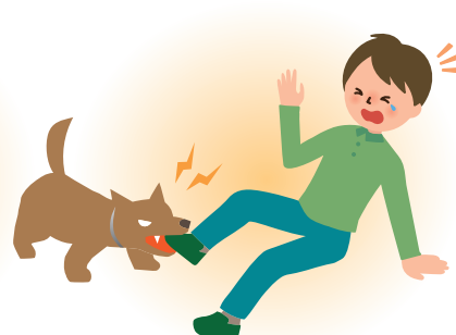
③他人の飼っている犬に咬まれた